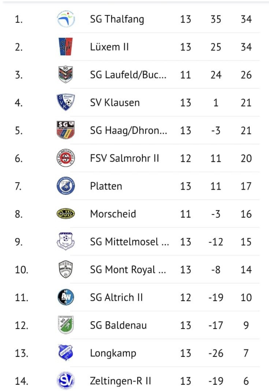
Tabelle Kreisliga B ST. 12